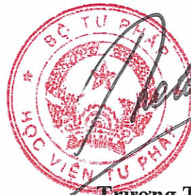
Trương Thế Côn